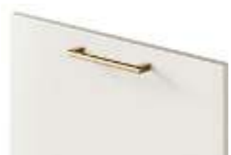
COD. 28316 MANIGLIA FINITURA OTTONE Brass finish handle . Poignée finition Laiton . Griff mit finish messing . Tirador acabado latón . Ручка с отделкой цвета латунь . 黄铜色饰面把手