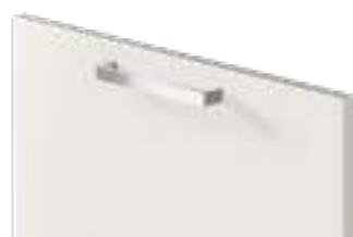
COD. 70507 MANIGLIA CROMATA Chrome-finish handle . Poignée chromée . Verchromter griff . Tirador cromado . Ручка хромированная . 镀铬把手