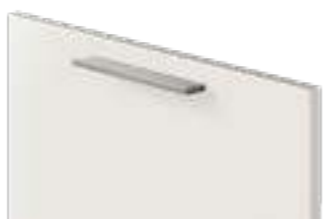
COD. 31610 MANIGLIA IN ALLUMINIO ANODIZZATO ACCIAIO SATINATO Satin finish anodised aluminium handle . Poignée en aluminium anodisé Acier satiné . Griff aus eloxiertem Aluminium, Stahl satiniert . Tirador de aluminio anodizado Acero satinado . Ручка из анодированного алюминия цвета Сталь сатирированная . 缎面钢阳极氧 化铝把手