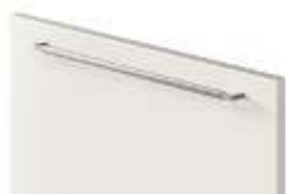
COD. 32704 MANIGLIA IN METALLO FINITURA ACCIAIO SATINATO ORIZZONTALE Horizontal satin steel finish metal handle . Poignée en métal finition Acier satiné horizontale . Horizontaler metallgriff mit finish anthrazit . Tirador horizontal de metal acabado acero satinado . Ручка из металла с отделкой Сталь сатирированная, горизонтальная . 水平缎面钢饰面金属把手