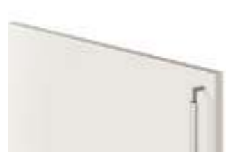
COD. 32714 MANIGLIA IN METALLO FINITURA ACCIAIO SATINATO VERTICALE Vertical satin steel finish metal handle . Poignée en métal finition Acier satiné verticale . Vertikaler metallgriff mit finish stahl satiniert . Tirador vertical de metal acabado acero satinado . Ручка из металла с отделкой сталь сатирированная, вертикальна . 垂直缎 面钢饰面金属把手