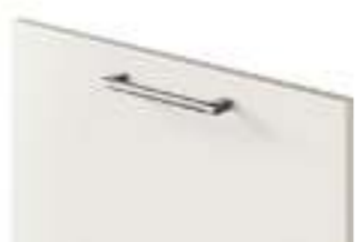
COD. 28320 MANIGLIA FINITURA SATINATA GODRONATA Knurled satin finish handle . Poignée finition satinée moletée . Griff mit finish satinieret und rändelbearbeitung . Tirador acabado satinado moleteado . Ручка с сатирированной отделкой, с насечками . 滚花缎面饰面把手