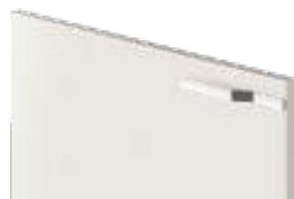
COD. 70503 MANIGLIA CROMATA Chrome-finish handle . Poignée chromée . Verchromter griff . Tirador cromado . Ручка хромированная . 镀铬把手