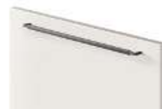
COD. 32703 MANIGLIA IN METALLO FINITURA ANTRACITE ORIZZONTALE Horizontal anthracite finish metal handle . Poignée en métal finition Anthracite horizontale . Horizontaler metallgriff mit finish edelstahl . Tirador horizontal de metal acabado antracita . Ручка из металла с отделкой антрацит, горизонтальная . 水平无烟煤色饰面金 属把手