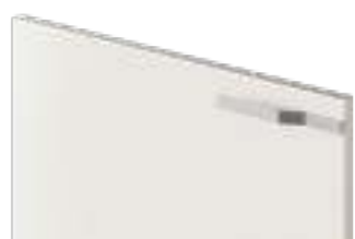
COD. 70504 MANIGLIA SATINATA Satin finish handle . Poignée satinée . Satinierter griff . Tirador satinado . Ручка сатирированная . 缎面把手