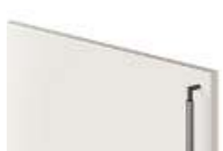
COD. 32713 MANIGLIA IN METALLO FINITURA ANTRACITE VERTICALE Vertical anthracite finish metal handle . Poignée en métal finition Anthracite verticale . Vertikaler metallgriff mit finish anthrazit . Tirador vertical de metal acabado antracita . Ручка из металла с отделкой Антрацит, вертикальная . 垂直 无烟煤色饰面金属把手