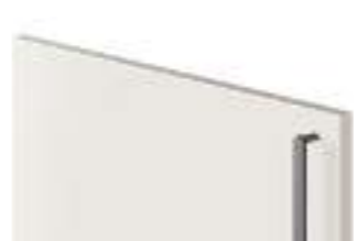
COD. 32711 MANIGLIA IN METALLO FINITURA ANTRACITE VERTICALE Vertical anthracite finish metal handle . Poignée en métal finition Anthracite verticale . Vertikaler metallgriff mit finish anthrazit . Tirador vertical de metal acabado antracita . Ручка из металла с отделкой Антрацит, вертикальная . 垂直 无烟煤色饰面金属把手