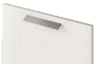
COD. 70506 MANIGLIA SATINATA Satin finish handle . Poignée satinée . Satinierter griff . Tirador satinado . Ручка сатирированная . 缎面把手