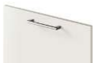
COD. 28315 MANIGLIA FINITURA INOX SATINATA Satin-finish stainless steel handle . Poignée finition inox satinée . Griff mit finish edelstahl satiniert . Tirador acabado inox satinado . Ручка с отделкой из нержавеющей стали, сатирированная . 缎面不锈钢饰面把手