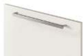
COD. 32702 MANIGLIA IN METALLO FINITURA ACCIAIO ORIZZONTALE Horizontal steel finish metal handle . Poignée en métal finition Acier horizontale . Horizontaler metallgriff mit finish edelstahl . Tirador horizontal de metal acabado acero . Ручка из металла с отделкой сталь, горизонтальная . 水平钢饰面金属把手