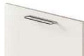
COD. 70517 MANIGLIA PONTE FINITURA INOX Stainless steel finish bridge handle . Poignée saillante finition inox . Brückengriff mit finish edelstahl . Tirador de puente acabado inox . Ручка-мостик с отделкой из нержавеющей стали . 不锈 钢饰面桥形把手