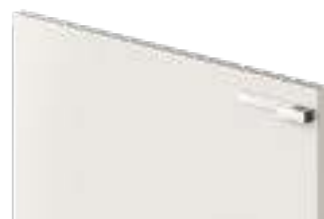
COD. 70501 MANIGLIA CROMATA Chrome-finish handle . Poignée chromée . Verchromter griff . Tirador cromado . Ручка хромированная . 镀铬把手