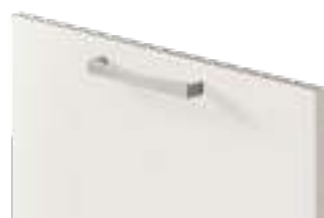
COD. 70508 MANIGLIA SATINATA Satin finish handle . Poignée satinée . Satinierter griff . Tirador satinado . Ручка сатирированная . 缎面把手