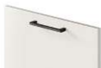
COD. 28314 MANIGLIA FINITURA NERA Black finish handle . Poignée finition noire . Griff mit finish schwarz . Tirador acabado negro . Ручка с отделкой цвета черный . 黑色饰面把手