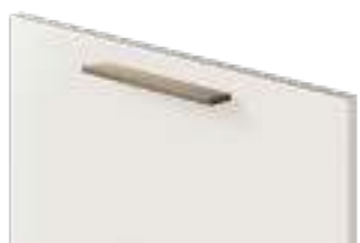
COD. 31602 MANIGLIA IN ALLUMINIO ANODIZZATO BRONZO Bronze anodised aluminium handle . Poignée en aluminium anodisé Bronze . Griff aus eloxiertem Aluminium, Bronze . Tirador de aluminio anodizado Bronze . Ручка из анодированного алюминия цвета Бронза . 青铜阳极氧化铝铝把手