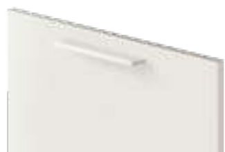
COD. 31601 MANIGLIA IN ALLUMINIO VERNICIATO OPACO BIANCO PRESTIGE Prestige White matt painted aluminium handle . Poignée en aluminium peint mat Blanc Prestige . Griff aus matt lackiertem Aluminium Prestigeweiß . Tirador de aluminio pintado mate Blanco Prestige . Ручка из окрашенного матового алюминия цвета Белый Prestige . 高贵 白哑光喷漆铝把手