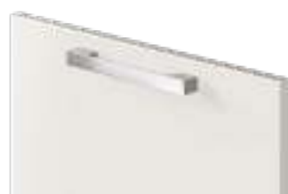
COD. 70515 MANIGLIA PONTE ZAMA CROMATA Chrome-finish zama bridge handle . Poignée saillante en zamac chromée . Verchromter zamak-brückengriff . Tirador de puente zamak cromado . Ручка-мостик из цам, хромированная . 镀铬锌合金桥形把手