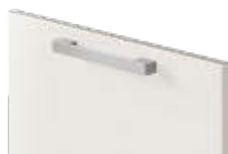
COD. 70516 MANIGLIA PONTE ZAMA SATINATA Satin finish zama bridge handle . Poignée saillante en zamac satinée . Satinierter zamak-brückengriff . Tirador de puente zamak satinado . Ручка-мостик из цам, сатирированная . 缎面锌合金桥形把手