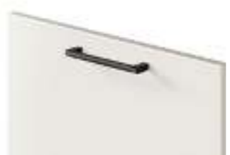
COD. 28319 MANIGLIA FINITURA NERA GODRONATA Knurled black finish handle . Poignée finition noire moletée . Griff mit finish schwarz und rändelbearbeitung . Tirador acabado negro moleteado . Ручка с отделкой цвета черный, с насечками . 滚花黑色饰面把手