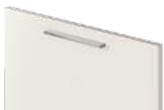
COD. 70510 MANIGLIA SATINATA Satin finish handle . Poignée satinée . Satinierter griff . Tirador satinado . Ручка сатирированная . 缎面把手