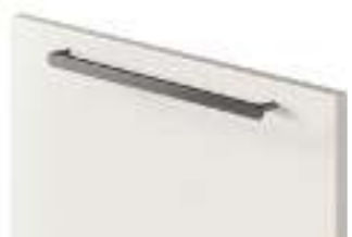
COD. 32701 MANIGLIA IN METALLO FINITURA ANTRACITE ORIZZONTALE Horizontal anthracite finish metal handle . Poignée en métal finition Anthracite horizontale . Horizontaler metallgriff mit finish edelstahl . Tirador horizontal de metal acabado antracita . Ручка из металла с отделкой антрацит, горизонтальная . 水平无烟煤色饰面金属 把手