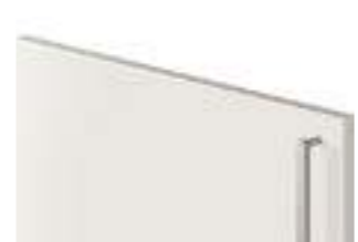
COD. 32712 MANIGLIA IN METALLO FINITURA ACCIAIO SATINATO VERTICALE Vertical satin steel finish metal handle . Poignée en métal finition Acier satiné verticale . Vertikaler metallgriff mit finish stahl satiniert . Tirador vertical de metal acabado acero satinado . Ручка из металла с отделкой сталь сатирированная, вертикальна . 垂直缎 面钢饰面金属把手