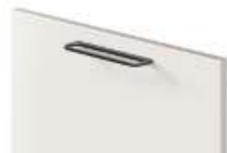
COD. 70518 MANIGLIA PONTE FINITURA NERA Black finish bridge handle . Poignée saillante finition noire . Brückengriff mit finish schwarz . Tirador de puente acabado negro . Ручка-мостик с отделкой цвета черный . 黑色饰面桥 形把手